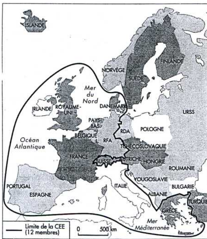
L'Europe en 1989.